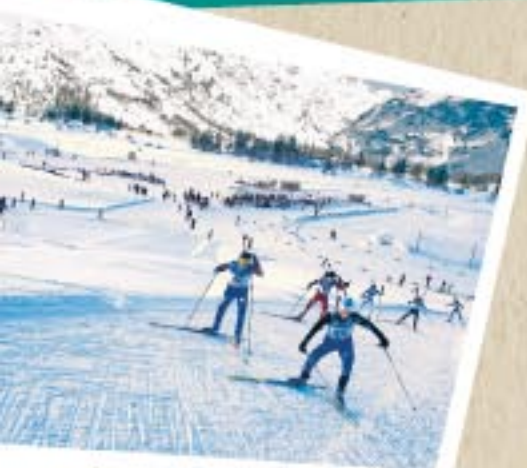
Le Marathon de Bessans : du spectacle et de l'émotion.