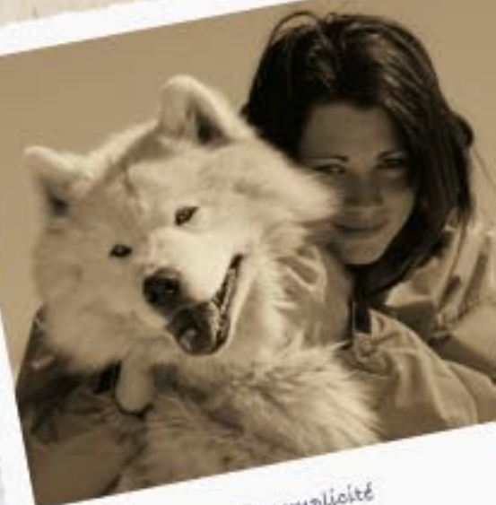
Vivre des moments de complicité