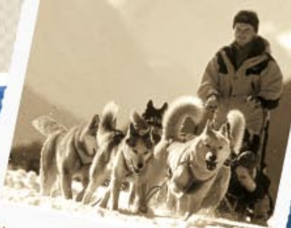
Humeur trappeur : devenez musher