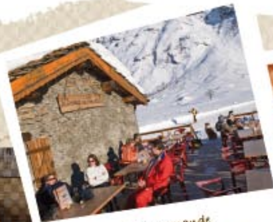
Prenez la pause gourmande