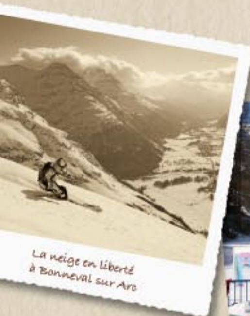
La neige en liberté à Bonneval sur Arc