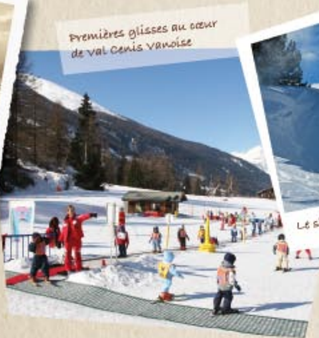
Premières glisses au cœur de Val Cenis Vanoise