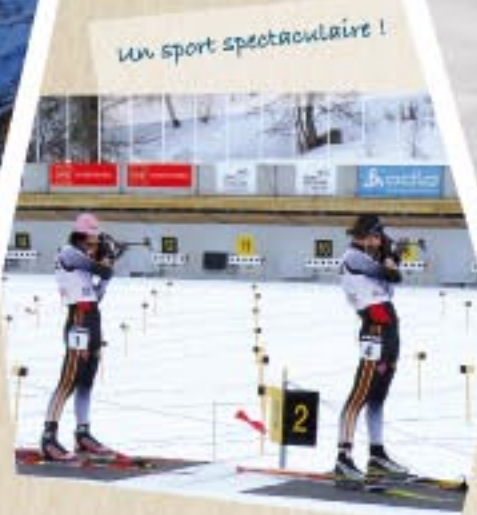
Un sport spectaculaire !