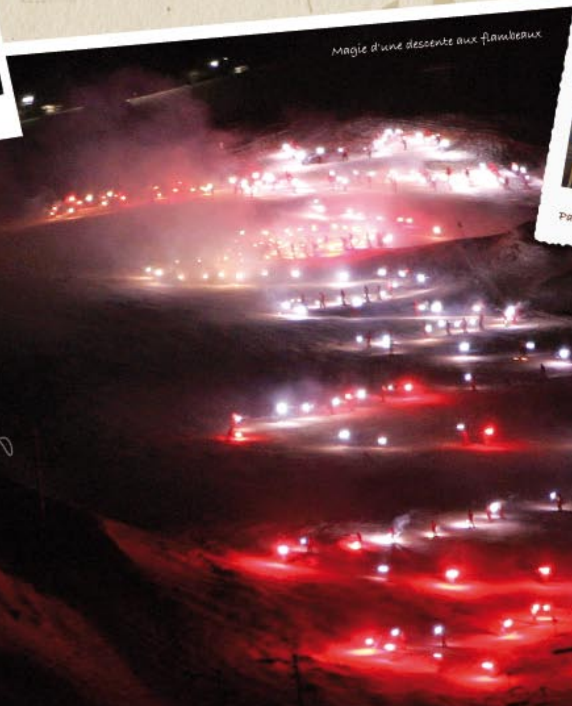
Magie d'une descente aux flambeaux