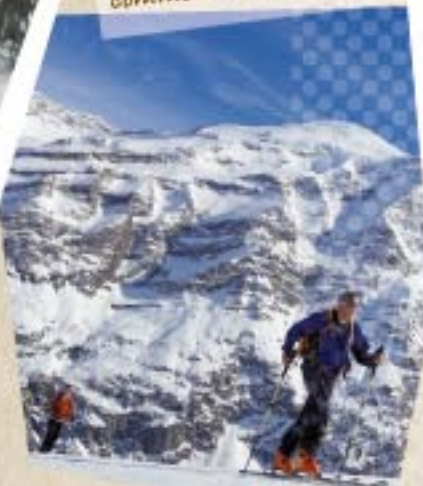
Liberté à la montée comme à la descente