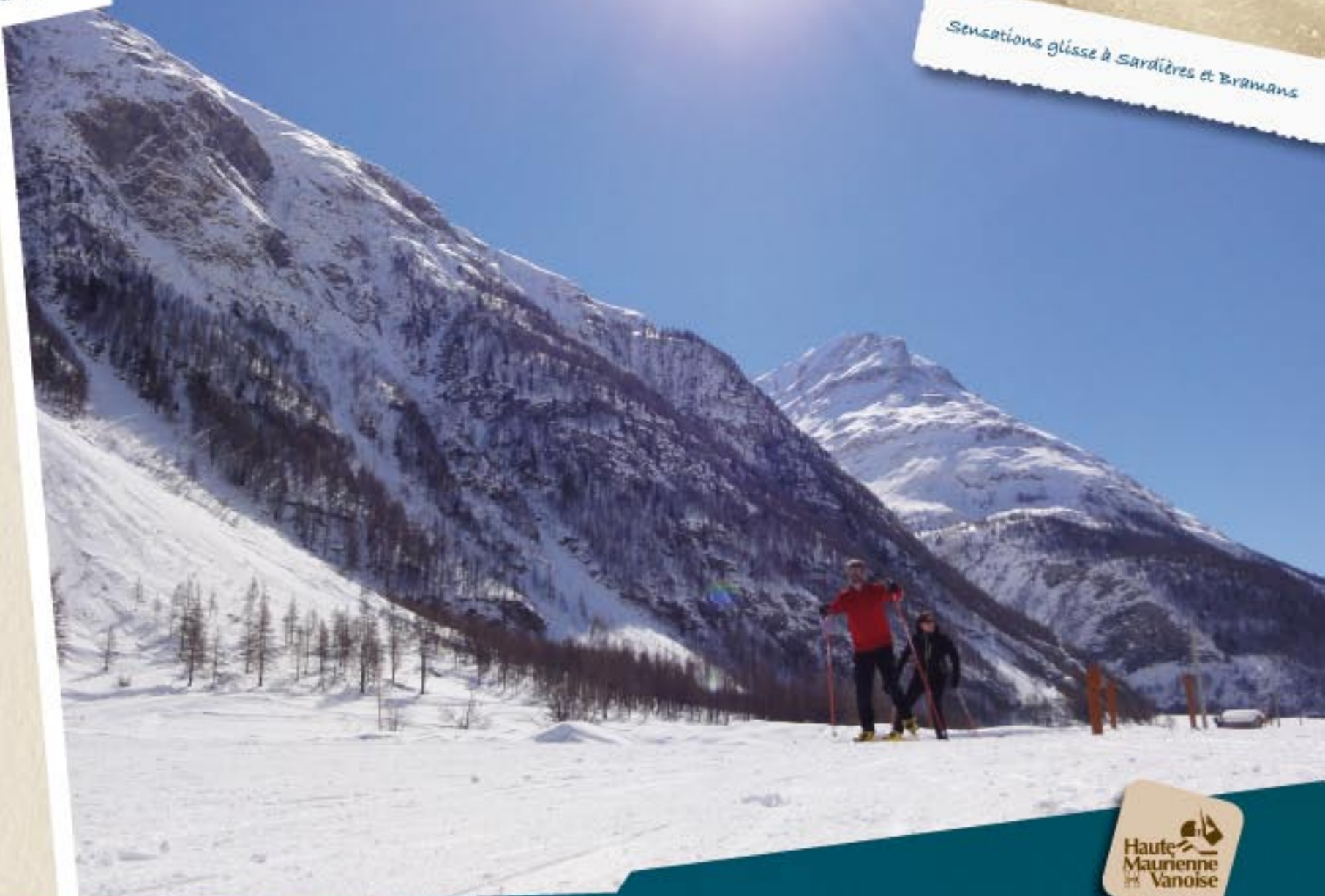
Sensations glisse à Sardières et Bramans