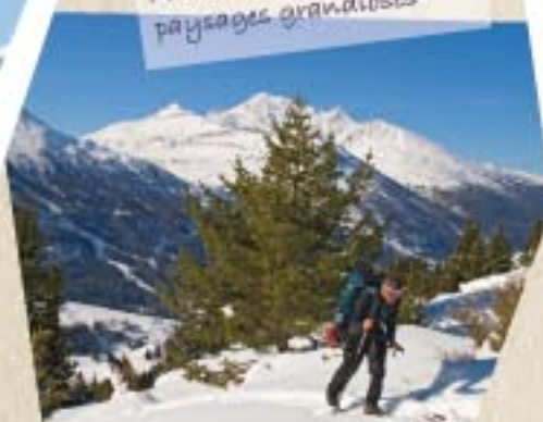
À la découverte de paysages grandioses