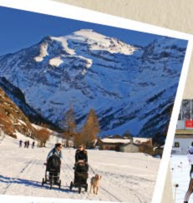
La neige balade, à ski, à pied... ou à roulette ici !