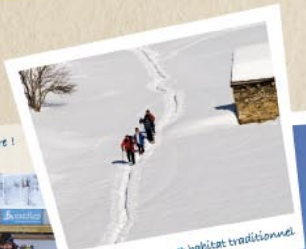
Sortie en raquettes et habitat traditionnel.