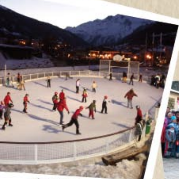
Glisse plaisir en nocturne, à la patinoire