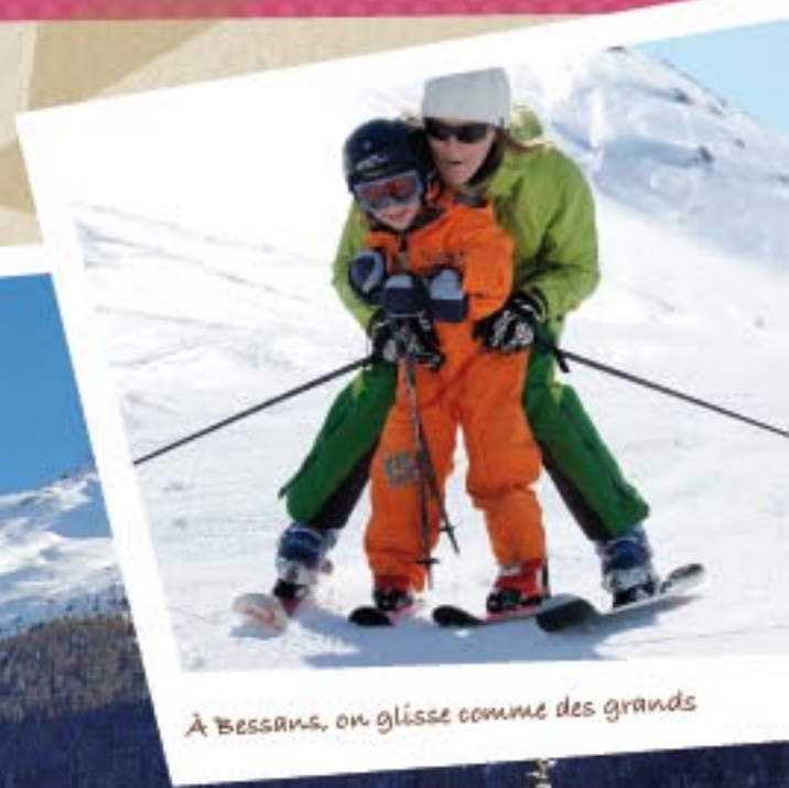
À Bessans, on glisse comme des grands