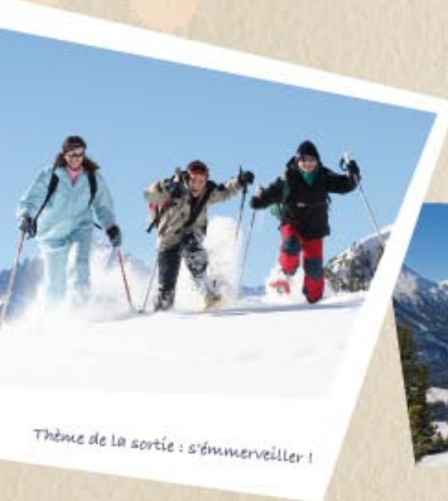
Thème de la sortie : s'émerveiller !