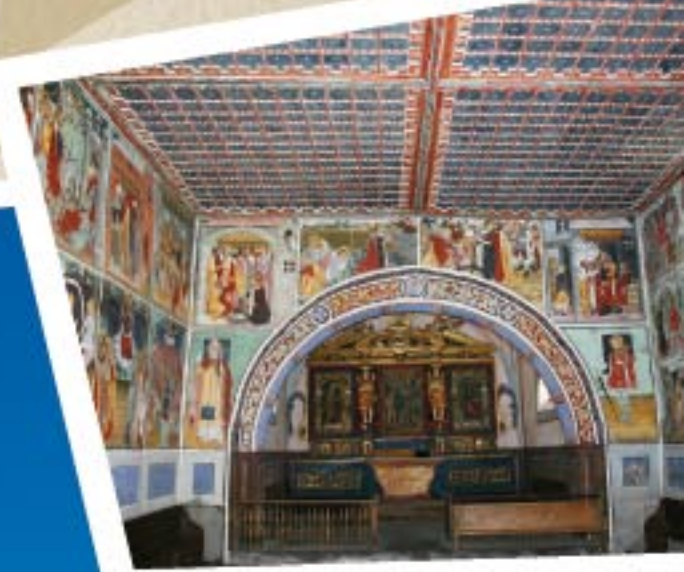
Chapelle saint-sébastien à val Cenis Lanslevillard