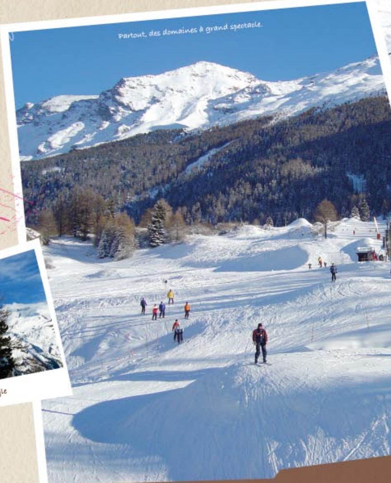
Partout, des domaines à grand spectacle.