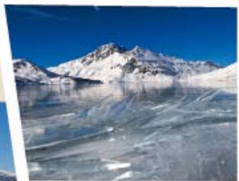
Laissez-vous enchanter par le Lac du Mont Cenis