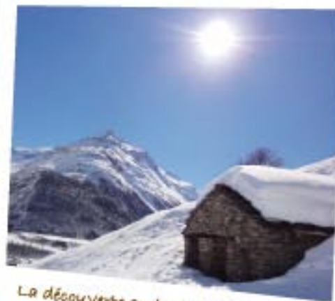
La découverte au bout du chemin

La Haute Maurienne Vanoise vous met tout sous les yeux : ses sommets majestueux à plus de 3500 mètres, le panorama sur les glaciers de la Vanoise, le charme historique de ses villages, le talent des artisans... Prenez le temps, plongez-vous dans l'ambiance, en promenade douce ou simplement depuis votre terrasse ensoleillée. Ce que vous allez voir va vous remplir le cœur.