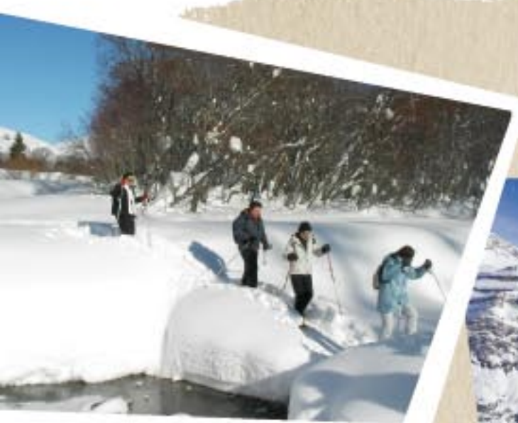
L'aventure à grands pas, ici au-dessus d'un des villages de Haute Maurienne vanoise