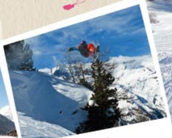
Le ski façon grand style