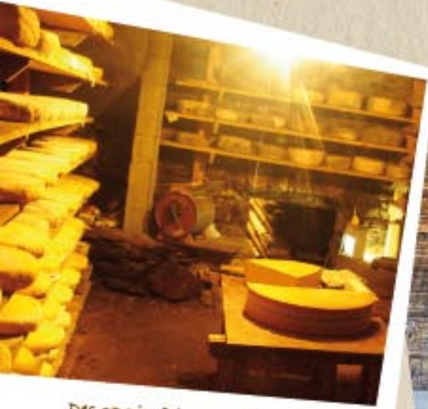
Des savoir-faire bien vivants !