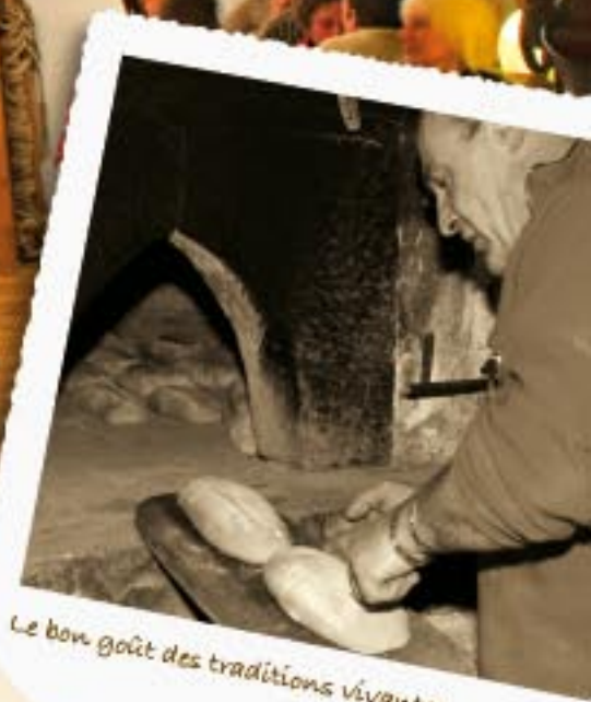
Le bon goût des traditions vivantes