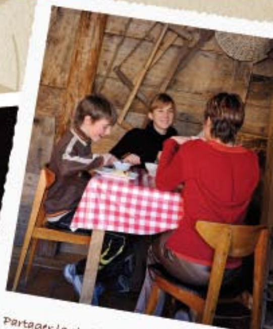
Partager la chaleur des bonnes tables