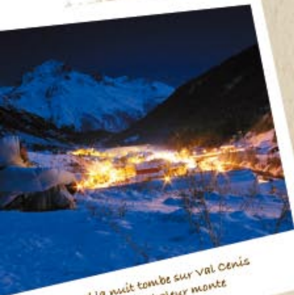
Quand la nuit tombe sur Val Cenis Lanslebourg, la chaleur monte